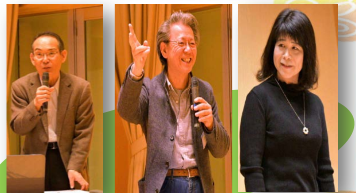
笑顔・笑顔・笑顔です♪