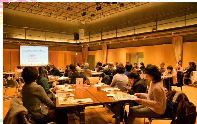
あたたかな雰囲気にもまれて熱心に受講